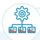
Tabla 1. Guías metodológicas asociadas a los requisitos PEI.

Los 3 requisitos gerenciales y 3 requisitos ambientales objetivo de esta cartilla, para los cuales se define una metodología para su estructuración son: